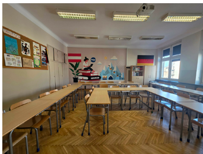
Sala języka niemieckiego, Szkoła Podstawowa nr 4.

W tym roku zaplanowano kolejne inwestycje. W Szkole Podstawowej nr 4 przy ul. Smoleńsk 5-7 zostanie wyremontowane zaplecze oraz sala gimnastyczna. Największym przedsięwzięciem będzie jednak gruntowna modernizacja placu zabaw w przedszkolu przy ul. Żuławskiego o wartości 650 000 zł. Po wakacjach dzieci wrócą do zupełnie odmienionej przestrzeni.