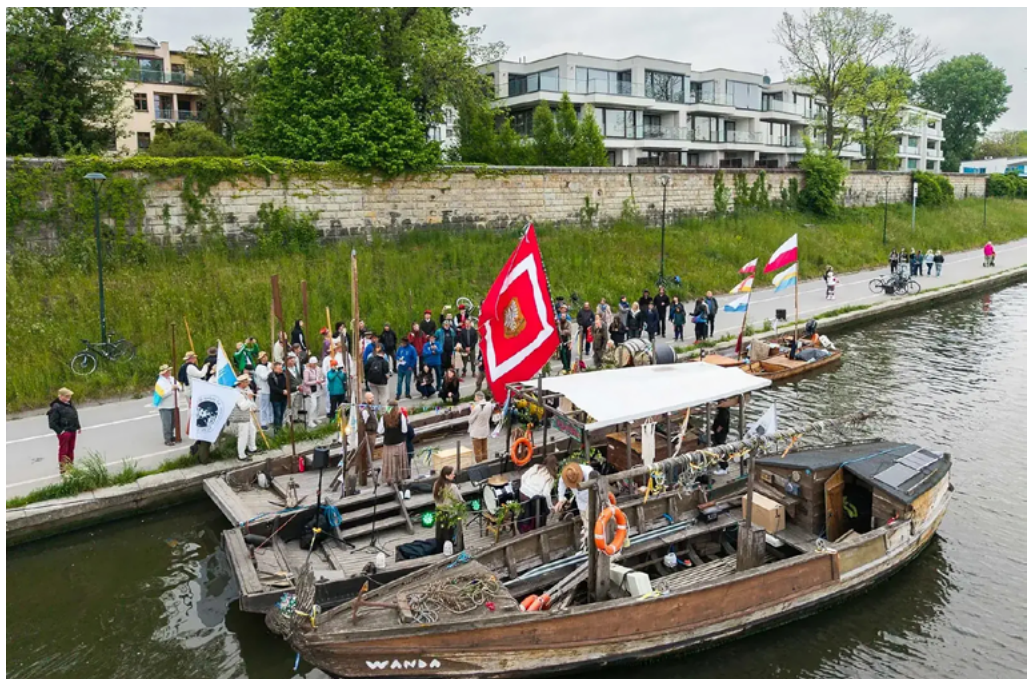
Uroczystości na Przystani Muzeum – Bulwar Rodła

Spływ, trwający trzy godziny w jedną stronę (i tyle samo z powrotem), miał bardzo atrakcyjny program. Mielśmy okazję posłuchać opowieści o tym, co można wyłowić z Wisły, ze specjalnym uwzględnieniem oraz pokazem pozostałości po zębach mamuta, a także o granatach odnalezionych po przeprawie niemieckiej w 1945 roku, jak również o bardziej przyziemnych artefaktach, o których przez grzeczność nie wspomnę. Była też opowieść o historii spływów flisackich oraz o budowie galarów. Mogliśmy się dowiedzieć, że w 1836 roku spo-