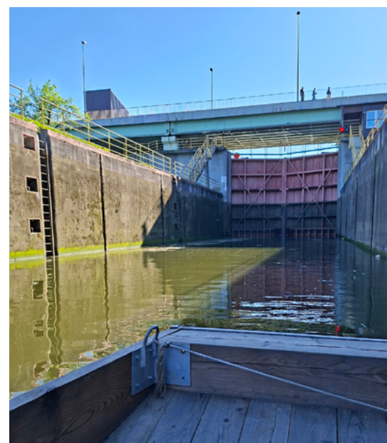
W śluzie Dąbie

Monika Bieniek Członek Zarządu Rady Dzielnicy I Stare Miasto