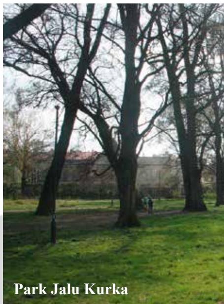
Park Jalu Kurka